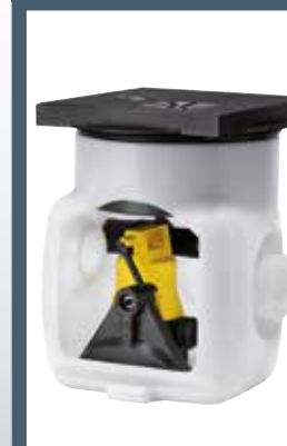
BAUFIX 50 UNTERFLURBEHÄLTER

Er hat die Erfahrung. Er berät Sie, welche Anlage aus dem Jung Pumpen Portfolio die für Sie richtige ist. Er baut die Anlage fachgerecht ein. Und Sie holen sich keine nassen Füße.