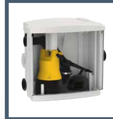
HEBEFIX PLUS ÜBERFLURBEHÄLTER

Wenden Sie sich an Ihren Installateur. Denn Rückstauschutz ist in jedem Fall ein Fall für den Profi.