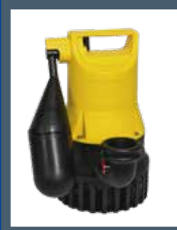
U 3 KS KELLERENTWÄSSERUNGSPUMPE