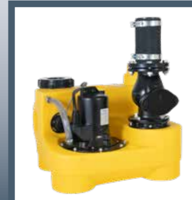
COMPLI 400 FÄKALIENHEBEANLAGE